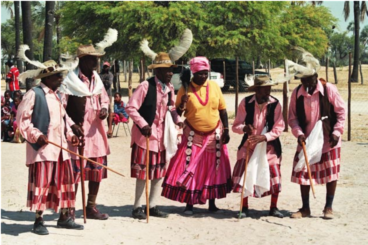
lita ya Kadha: Kulturelle Gruppe aus Elim