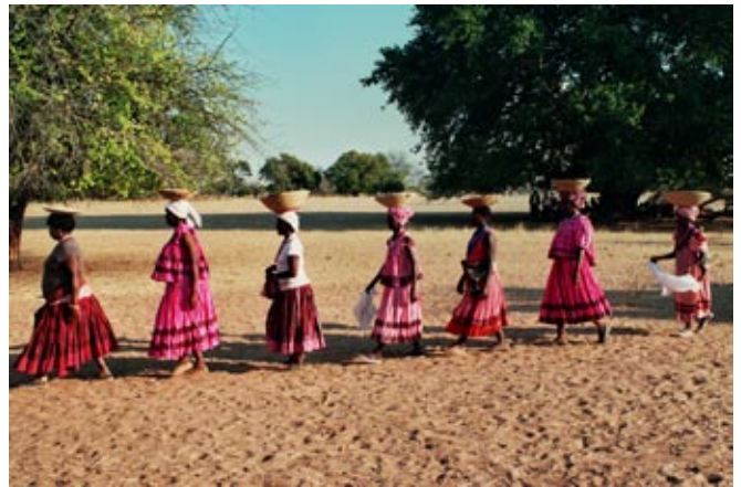
Anstehen fürs Geschenke überreichen

Die weiblichen Angehörigen der Braut nahmen nun singend Abschied von ihrer Tochter, die nun das elterliche Gut verlassen wird und eine grosse Lücke hinterlässt. Bei einigen entdeckten wir Tränen des Abschieds, doch schon bald darauf erschien wieder ein fröhliches Lächeln und Trällern. Die Gäste versammelten sich nun im Schatten eines Baumes im Kreis um das Brautpaar und nach einer längeren Glückwunschede bildeten einige der Gäste eine lange Reihe, ihre Geschenke auf dem Kopf balancierend. Mit lautem Freudengeschrei wurden die Geschenke dem Brautpaar überreicht.