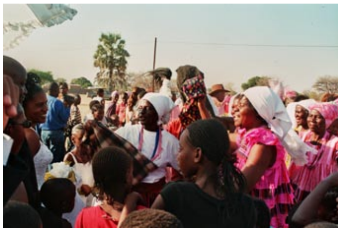
Das Brautpaar wird umjubelt

Im Anschluss bewegten sich die Gäste zum elterlichen Homestead 1) von Selma und warteten tanzend bis die Familie der Braut das Brautpaar hinein bat.