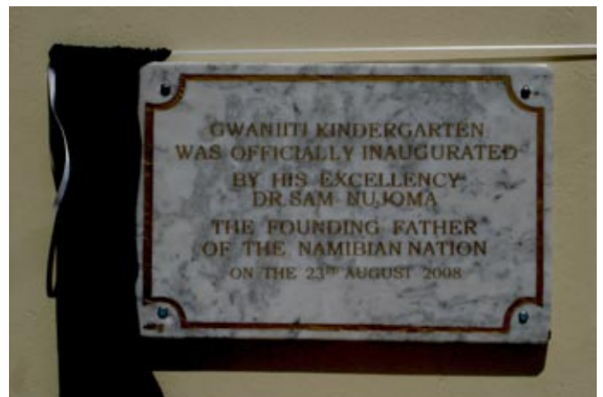
Der Kindergarten ist eröffnet

Endlich ging es über in die offizielle Einweihungszeremonie. Sam Nujoma hielt eine kurze Ansprache in Oshivambo, übersetzte jedoch in die offizielle Landessprache Englisch und enthüllte darauf hin die Eröffnungsplakette.