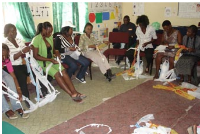
Aus Plastiksäcken werden Seile

Auch in diesem Trimester wurde ich von den regionalen Verantwortlichen angefragt, einen Teil des zweiwöchigen Workshops für Kindergärtnerinnen zu leiten. Dieses Mal verfügte ich über etwa zwei Tage Zeit für die Vorbereitung, was eine deutliche Steigerung gegenüber dem letzten Vortrag war. Im ersten Teil behandelten wir den Umgang mit Büchern im Kindergarten, ein Thema das für die meisten Teilnehmenden eher fremd und unbekannt war. Mehr Interesse und Motivation konnte ich beim zweiten Thema „Spielmöglichkeiten draussen“ feststellen.