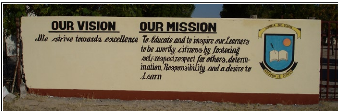
Eingang zur Ashipala Secondary School