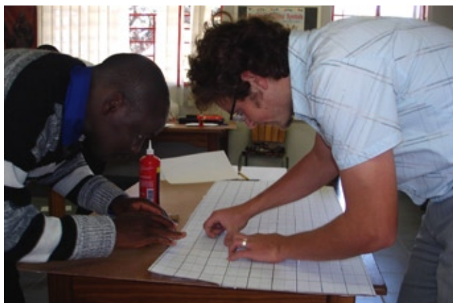
Herstellen eines Graphboards

Durch die Zusammenarbeit mit den Lehrkräften habe ich ein Problem festgestellt, das den Unterricht an vielen Schulen beeinträchtigt. Für Themen wie Geometrie, Spiegelungen und Graphen benötigt eine Lehrkraft eine Wandtafel mit Gitternetz. Was in der Schweiz zur Standardausstattung von Schulzimmern gehört ist hier die grosse Ausnahme. Die meisten Lehrkräfte lösen dieses Problem, indem sie für jede neue Aufgabe das Gitternetz mit Lineal und Kreide neu an die Wandtafel zeichnen. Damit verlieren sie viel wertvolle Zeit, die dann nicht für das Wesentliche vorhanden ist.