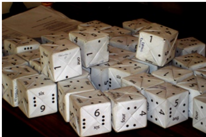
Ergebnis eines Projekts in Mathematik

Das Angebot wurde bisher von sechs Lehrkräften wahrgenommen, weitere drei haben sich für das laufende Trimester gemeldet, da sich das Projekt auch gut als Prüfungsvorbereitung eignet. Bei einigen habe ich die Durchführung des Projekts verbunden mit einer Mitarbeiterbewertung. Das heisst, ich habe zum Teil den Lektionsinhalt vorgegeben und dann die Lektion auch bewertet. Dies wurde erstaunlicherweise gut aufgenommen.