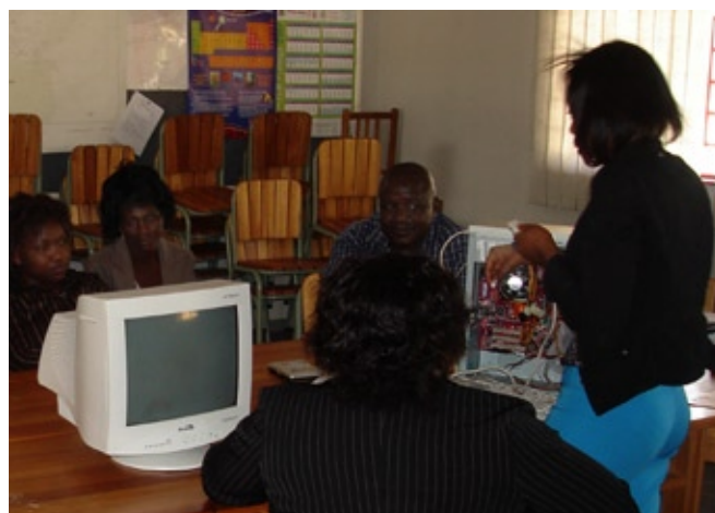
Erklären der Computer Bestandteile

Ich habe davon Gebrauch gemacht und allen Schulsekretäre und -innen im Bezirk eine Einführung in Computer und Tabellenkalkulation gegeben, damit sie ihre administrativen Aufgaben, vor allem Datenverwaltung schneller und effizienter ausführen können. Den Workshop führte ich zusammen mit einer der Sekretärinnen durch, die sich sehr gut mit Computern auskennt. Obwohl die meisten Sekretäre und Sekretärinnen an ihren Schulen mit Computern arbeiten, war es für fast alle das erste Mal, einen Computer von innen zu betrachten und die Einzelteile kennen zu lernen.