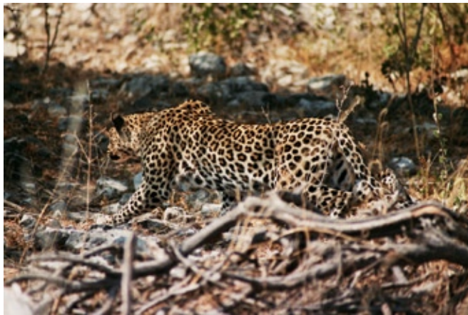
Leopard beim Jagen

Den Anfang machten wir im Etoscha Nationalpark, der sich uns wieder einmal in seiner ganzen Pracht präsentierte. Während diesen Tagen bewunderten wir nebst vielen anderen Tieren Elefanten und drei junge Löwen beim Spielen. Unterwegs zu einem weiteren Wasserloch sprang uns beinahe ein Leopard vor das Auto. Wer von uns mehr erschrocken ist, ist schwer zu sagen.