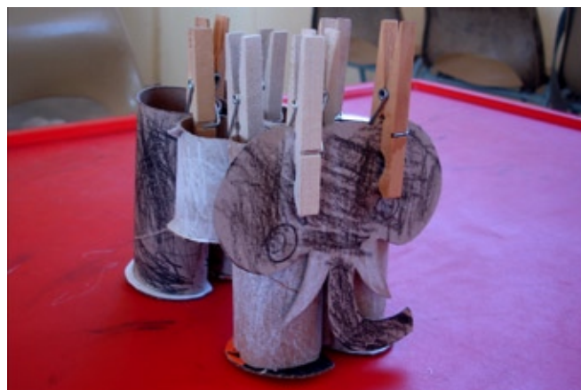
Gruppenarbeit zum Thema Elefant