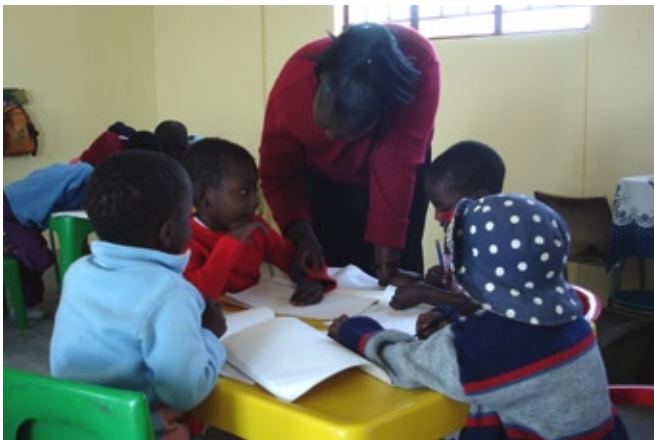
Arbeiten in der Kleingruppe

Während der Zeit des Freispiels können die Lehrkräfte die Möglichkeit nutzen um mit einer Kleingruppe zu arbeiten, so zum Beispiel den Kindern beizubringen, den eigenen Namen zu schreiben.